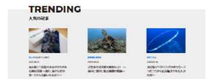
閲覧記事に紐づく機能