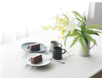
A: フラワーベースセット(左上) B: フラワーベース&マグ 2 個セット(右上) C: フラワーベース&マグ・プレート 2 個セット(左下) ※各コースイメージ画像